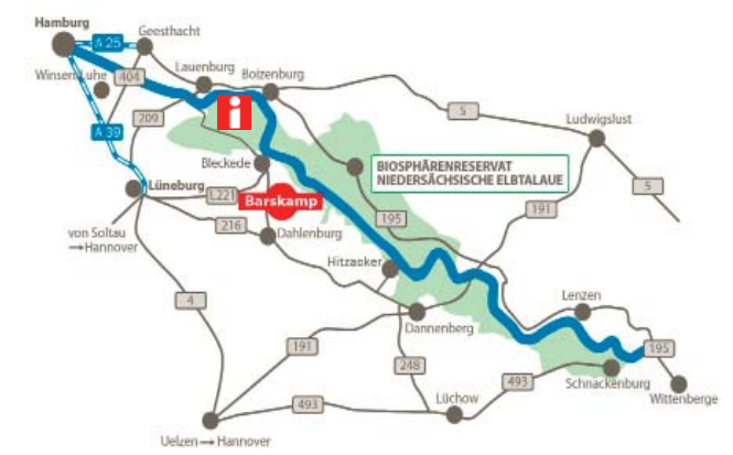
Eine Detailkarte zum Schieringer Forst finden Sie auf der Innenseite