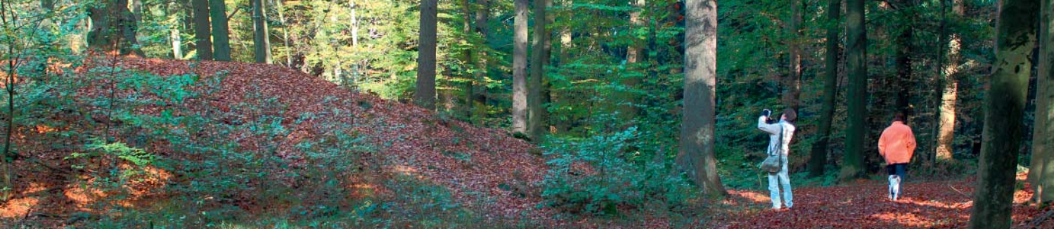
Der sogenannte Opferberg erhebt sich fast vier Meter hoch im Buchenwald