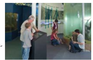
Text, Bilder, Grafiken und Karren: Andrea Schmidt Anfahrtskizze: Thomas Laukat

Öffnungszeiten: April bis Oktober November bis März täglich von 10 bis 18 Uhr Mi - So von 10 bis 17 Uhr